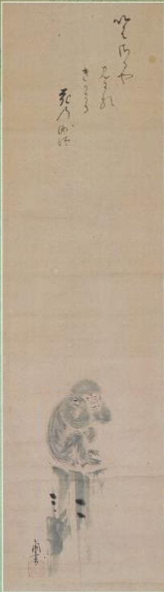
立圖「いはざるや」画賛