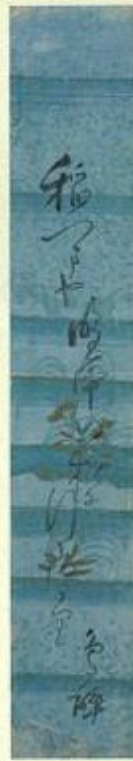
鳥酔「稲つまや」発句